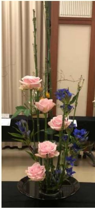
フランダースの犬

昨年度の桜凛祭で展示した作品をご紹介します。 それぞれに好きな物語をイメージして生けました。