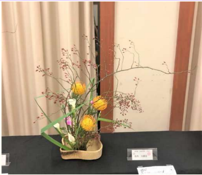
ジャックと豆の木