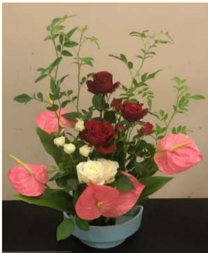
不思議の国のアリス