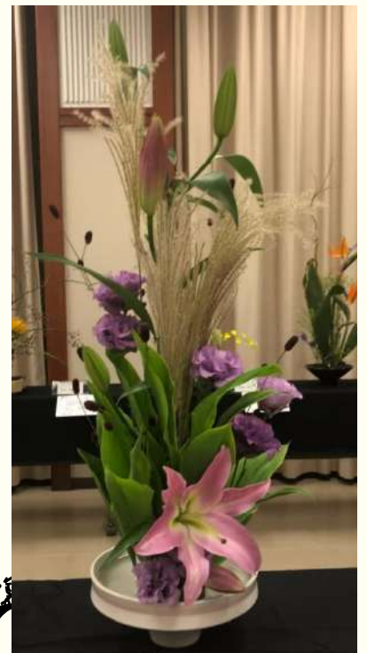
ブレーメンの音楽隊